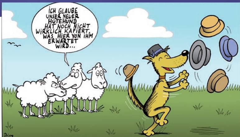
Tier-Punkt-Comic von Dominik Lang

Achtung: Gehen Sie bei einer Fütterungsumstellung immer langsam vor, da Meerschweinchen mit Durchfall reagieren können. Wird Durchfall zu spät behandelt, kann das zum Tod der Tiere führen. Deshalb sollte auch regelmäßig das Hinterteil kontrolliert werden. Kahle Stellen hinter den Ohren und an den Brustwarzen sind ganz normal, aber alle anderen haarlosen oder schorfigen Stellen sind sind „Alarmglocken“.