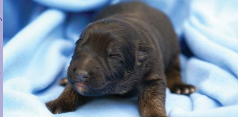
Wenn Sie sich für einen Welpen entscheiden: Handeln Sie überlegt und wenden Sie sich nur an anerkannte Züchter.

► Kaufen Sie auf gar keinen Fall dort, wo mehrere Rassen angeboten wer-