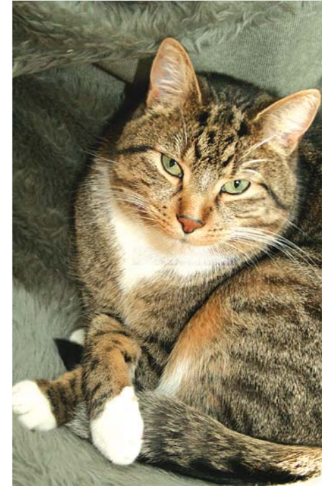
Kater Elvis: eine Woche im Ausnahmezustand

Eine heftige Woche liegt hinter mir. Mein Herrchen war geschäftlich unterwegs und ich war plötzlich der einzige Mann im Haus! Unordnung ade: Keine Decke blieb auf der Couch liegen, kein Kühlschrank stand offen, kein Stück Käse blieb auf dem Esstisch liegen. Niemand vergaß den frischen italienischen Schinken auf dem Tisch! Alles super ordentlich. Ein Graus!