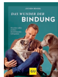
Das Wunder der Bindung Jochen Bendel

Sowohl einfühlsam als auch unterhaltsam schreibt der Autor, TV-Moderator und Hundetrainer Jochen Bendel über die Erfahrungen mit seinem Hunde-Duo Gizmo und Khaleesi und über den Hunde-Schul-Alltag. Jochen Bendel nimmt den Leser mit auf eine sehr persönliche, lustige und erfrischend selbstkritische Reise. Es sind inspirierende Bindungsgeschichten, die zum Schmunzeln und Nachdenken anregen.